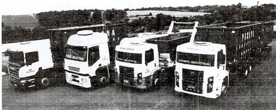
Imagem n.º 01 – Alguns equipamentos disponíveis

5 Condição de Pagamento: Conforme edital de contratação.